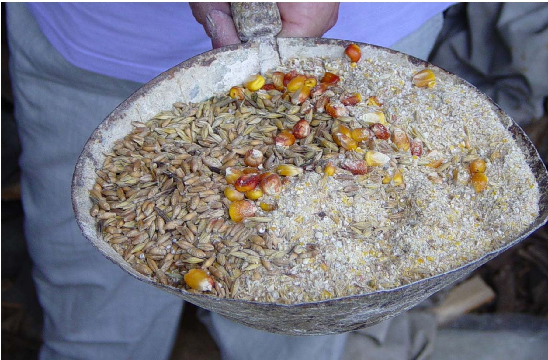
Presentatie VoederWaarde.nl , aug. 2017